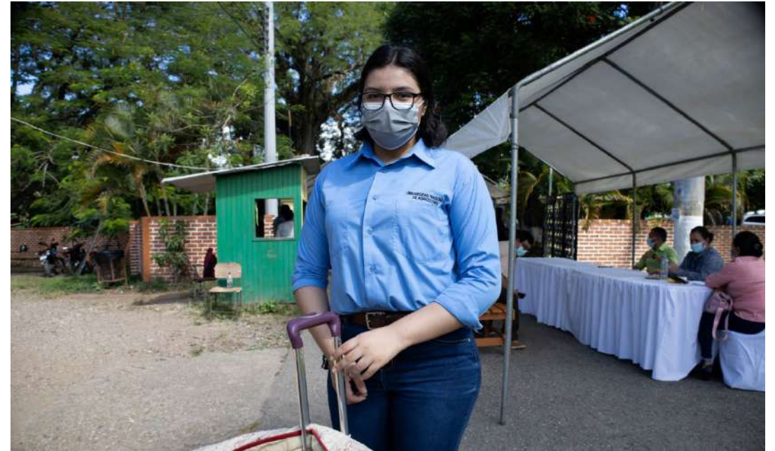
Uniforme de la Universidad Nacional de Agricultura